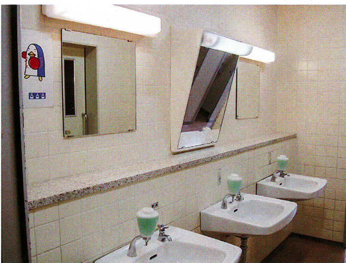
車椅子の方にも使いやすい配慮がされた手洗い